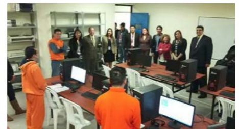
Se realizó el lanzamiento del Proyecto Educativo de Reinserción Social en el CRS Regional Cotopaxi

Como parte de esta fase se incluirá un taller de ensamblaje de computadoras con servicios externos, como plan piloto para la etapa de mediana seguridad del CRS Latacunga. El proceso se financiará con recursos de CISCO.